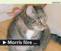
► Morris före ...