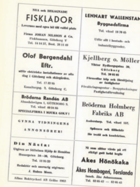
Din Nästa nummer 1, 1957