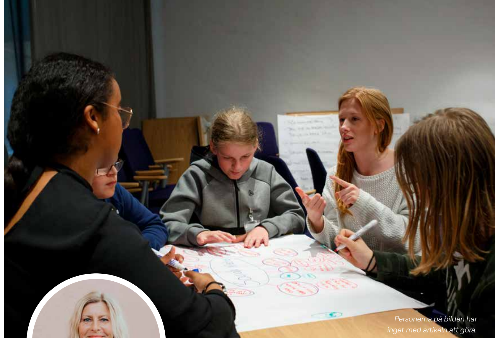
Personerna på bilden har inget med artikeln att göra.